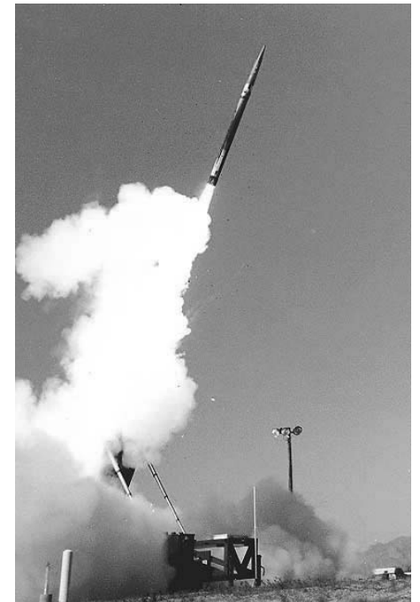
THAAD Rakete

Die neue Planung sei nicht nur besser an die Bedrohungsentwicklung angepasst, flexibler und kostengünstiger, sie erlaube auch eine viel intensivere Zusammenarbeit mit den Verbündeten in der NATO und mit Russland, heißt es in Washington. Zudem ermöglicht sie eine bessere Koordination mit anderen landgestützten Abfangsystemen für Kurz- und Mittelstreckenraketen wie zum Beispiel Patriot und THAAD.