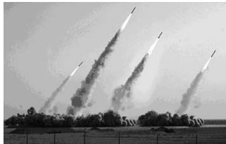
angebliche Raketenbatterie

Kritiker der Raketenabwehr in den USA weisen zudem darauf hin, dass auch Obamas Plan für die Raketenabwehr in Europa technische Risiken birgt und keinen glaubwürdigen Schutz garantiert. Ähnlich wie das von George W. Bush geplante Raketenabwehrsystem seien die Abfangraketen vom Typ SM-3 noch nie unter realitätsnahen Bedingungen gegen angreifende Raketen mit Täuschkörpern getestet worden.