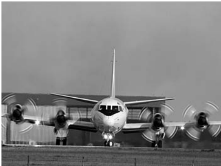
Bild: Seefernaufklärer Orion P-3C

Die Militäroperation »Atalanta« kann die Piraten am Horn von Afrika offenbar nur mäßig abschrecken. In den ersten neun Monaten dieses Jahres wurden nach Angaben der Internationalen Seefahrtsbehörde (IMB) mehr Angriffe von Piraten verzeichnet als im gesamten vergangenen Jahr.