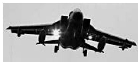
Der »Tornado« wurde als Träger von Atomwaffen konzipiert, die Piloten sind entsprechend ausgebildet

Sicherung der ökonomischen, militärischen und ideologischen Vormachtstellung des Westens durch überlegene militärische Gewalt, militärische Interventionen einschließlich des Einsatzes von Atomwaffen. Dabei sollen nicht nur Ressourcenkonflikte (es geht nicht nur um Öl, sondern um alle fossilen und mineralischen Rohstoffe) im Zweifelsfall militärisch gelöst werden, sondern auch aktuelle globale Probleme, wie z.B. Klimawandel, Energieversorgungen, Immigrationsströme und Hungerkatastrophen. Die