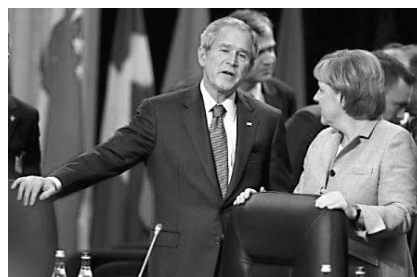
Bush und Merkel in Bukarest

Westen die Empfehlung des großen Strategen Zbigniew K. Brzezinski aus den 90er Jahren beherzigt: Für die "globale Vormachtstellung und das historische Vermächtnis Amerikas" werde es "von entscheidender Bedeutung sein", so können wir in seinem Buch "Die einzige Weltmacht" (1997) lesen, "wie die Macht auf dem eurasischen Kontinent verteilt wird". Der "eurasische Kontinent" - darunter verstand Brzezinski vor allem die Region vom Schwarzen Meer, dem Kaukasus und dem Kaspischen Meer bis nach Zentralasien -- ist also das "Schachbrett, auf dem sich auch in Zukunft der Kampf um die globale Vorherrschaft abspielen wird".