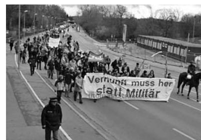
Ostermarsch 2008

Großdemonstration in Straßburg 04. April 2009