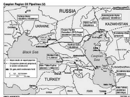
Ölpipelines in der Kaspischen Region

Dabei könnte ein Blick nach Afghanistan hilfreich sein. Auch dieses Land hat nicht viel mehr zu bieten als eine für den Westen interessante geostrategische Lage. Dabei geht es nicht nur um die Kontrolle eines Territoriums, in dem bzw. durch das hindurch ein wichtiges Ölpipeline-Projekt realisiert werden soll: die Verbindung zwischen der öl- und erdgasreichen