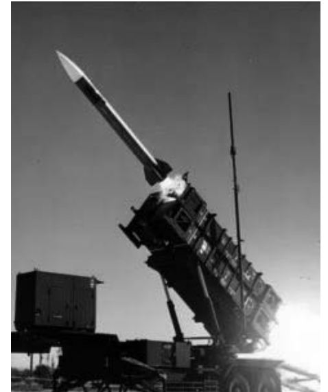
MIM 104 Patriot Rakete beim abfeuern

positiv.“ Russland hat auch seine Mitgliedschaft in der „NATO-Partnership-for-Peace“ nicht gekündigt. Ich gehe davon aus, dass die Verstimmung zwischen der NATO und Russland von vorübergehender Natur ist.